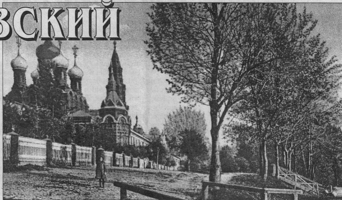
Черниговский скит. Фото начала XX века.

Поселился он не в самом скиту, а в ветхой лесной сторожке (по другим источникам — в пе-