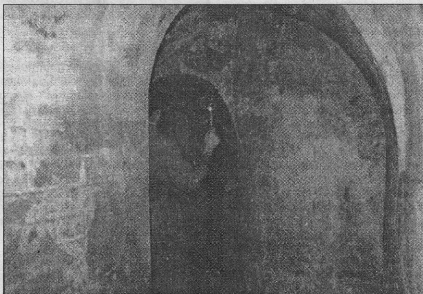
Пещеры Черниговского скита сегодня.