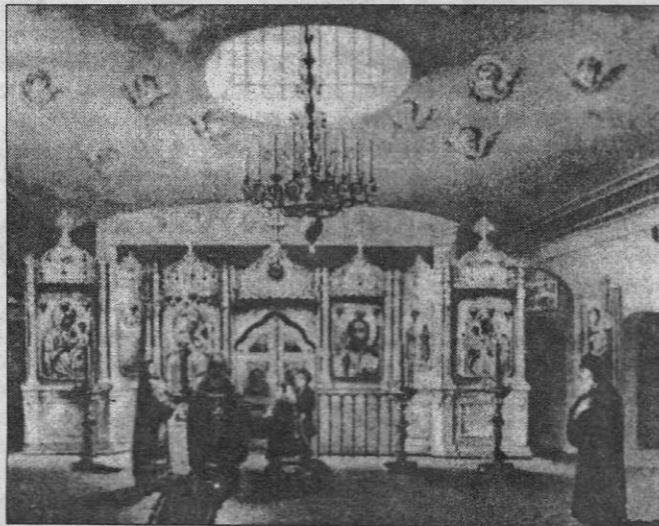
В пещерном храме архистратига Михаила.