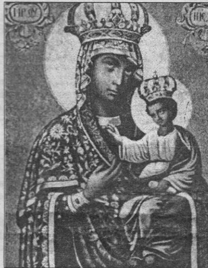
Икона Черниговской Божией матери. (Литография).