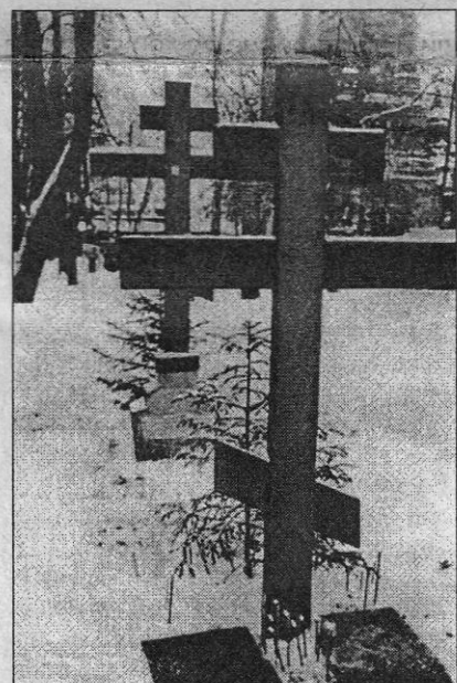
Могилы В. В. Розанова и К. Н. Леонтьева на погосте Черниговского скита.

Память, как и рукописи, не исчезает в поколениях. Розанов оставил свое завещание и напоминание потомкам о страшном времени, которое переживала Россия и он, «маленький Розанов», вместе с семьей и со всеми после 1917 года. Это полный текст «Апокалипсиса нашего времени», рукопись, которую стало возможно напечатать только теперь, через восемь десятилетий.