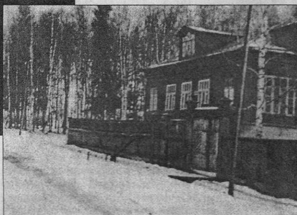
Красюковка. Дом, где жил и умер В. В. Розанов. 1928 г.

Он умер 5 февраля 1919 года в доме на Красюковке. Похоронен на погосте Черниговского скита.